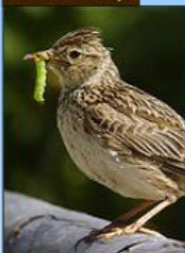
Alouette des champs

Taille : 18 à 19 cm Envergure : 35 cm Habitat : campagnes ouvertes, zones cultivées, marais, prairies et dunes. Alimentation : insectes, larves, vers de terre, graines. Caractéristiques : La tête possède de longues plumes formant une crête qui se hérisse à certains moments. Les yeux sont brun foncé. Le bec est relativement court et de couleur corne.