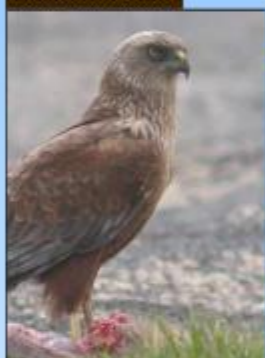
Busard des roseaux

Taille : 48 à 56 cm Envergure : 120 à 135 cm Habitat : le busard des roseaux niche dans les roseaux des marais. Il est présent sur les continents asiatique, africain et européen. Alimentation : petits mammifères aquatiques, insectes. Caractéristiques : fine silhouette aux longues ailes coudées. Plumage brun sombre, manteau roux sombre. On le reconnaît par son vol lent, alterné de battements et de glissades.